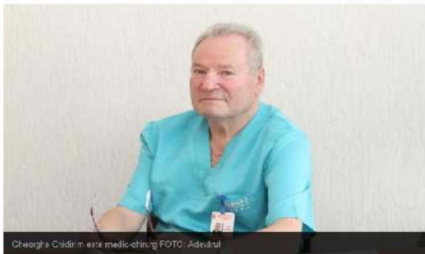
Gheorghe Ghidirim este medic-chirurg.

Academicienii Gheorghe Ghidirim și Ion Ababii vor obține titlul de Cetățean de onoare al Chișinăului. Consiliul municipal Chișinău a luat decizia astăzi, la propunerea liberal-democratului Sandu Gheorghiș.