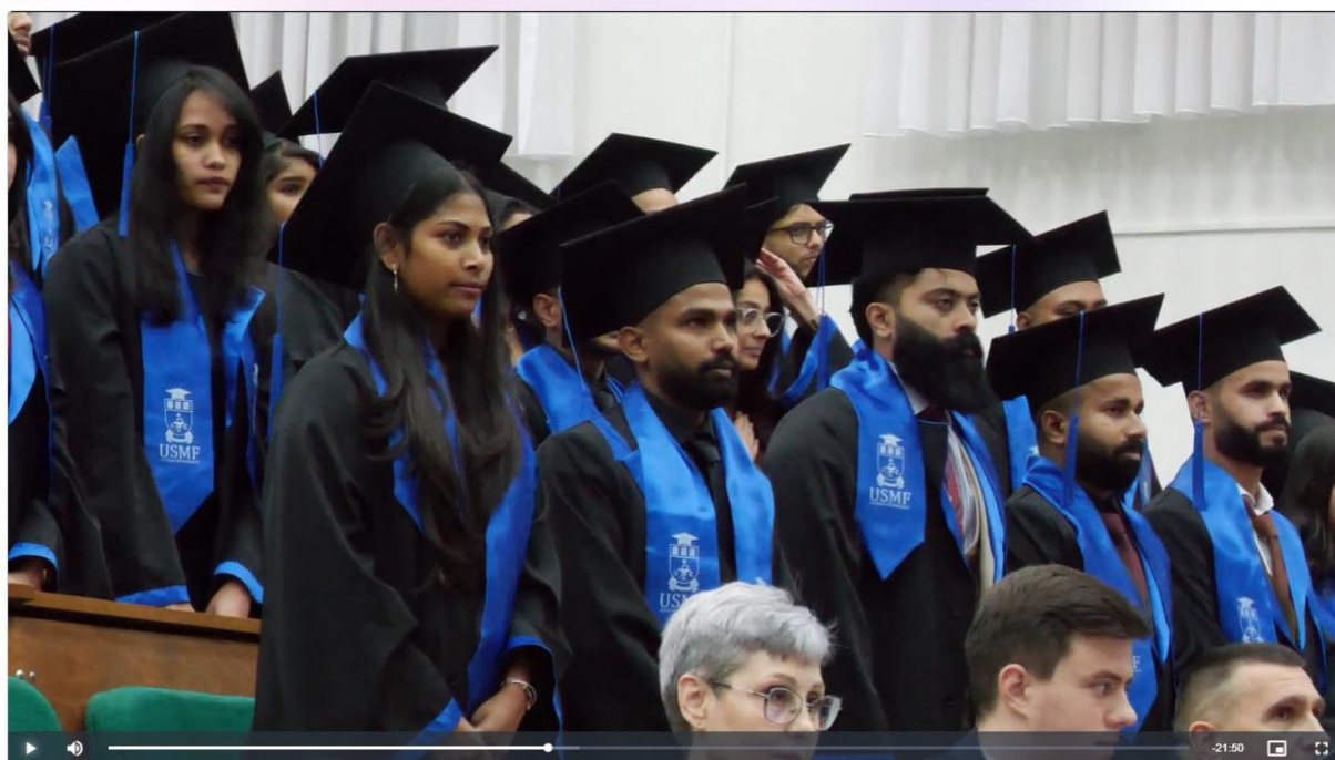
Ceremonia depunerii Jurământului medicului de către absolvenții internaționali, Promoția 2024 – partea a II-a

Link: https://www.privesc.eu/arhiva/107712/Ceremonia-depunerii-Juramantului-medicului-de-catre-absolventii-internationali--Promotia-2024---partea-a-II-a