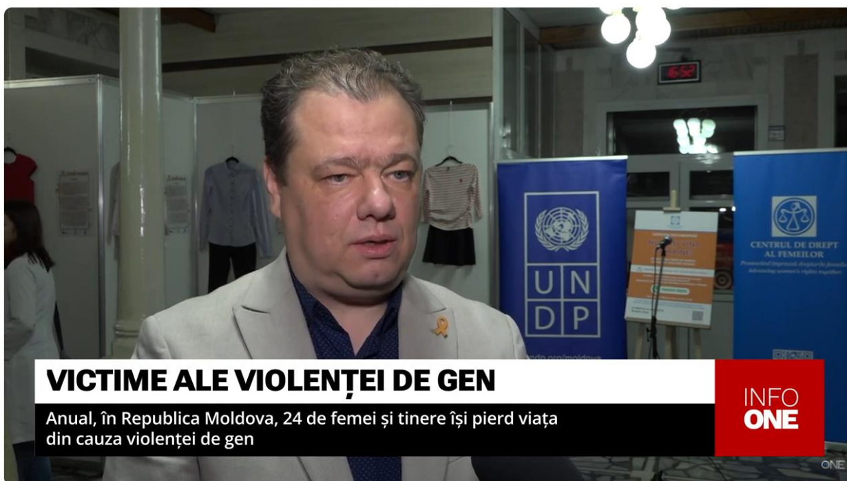
INFO ONE - ÎȘI PIERD VIAȚA DIN CAUZA VIOLENȚEI DE GEN

Link: https://www.youtube.com/watch?v=cYgBOet57go