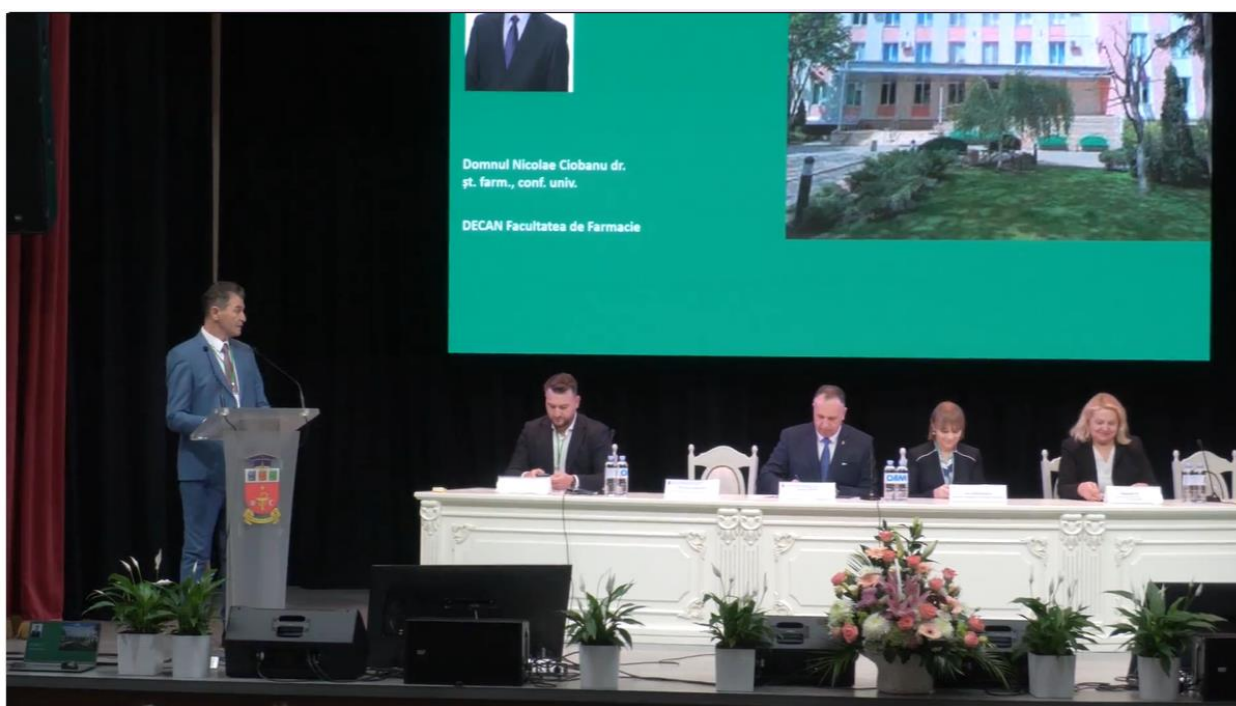
Al X-lea congres al Farmaciștilor din Republica Moldova „Facultatea de Farmacie - șase decenii de inovație și progres”

Link: https://www.privesc.eu/arhiva/107548/Al-X-lea-congres-al-Farmacistilor-din-Republica-Moldova--Facultatea-de-Farmacie---sase-decenii-de-inovatie-si-progres-