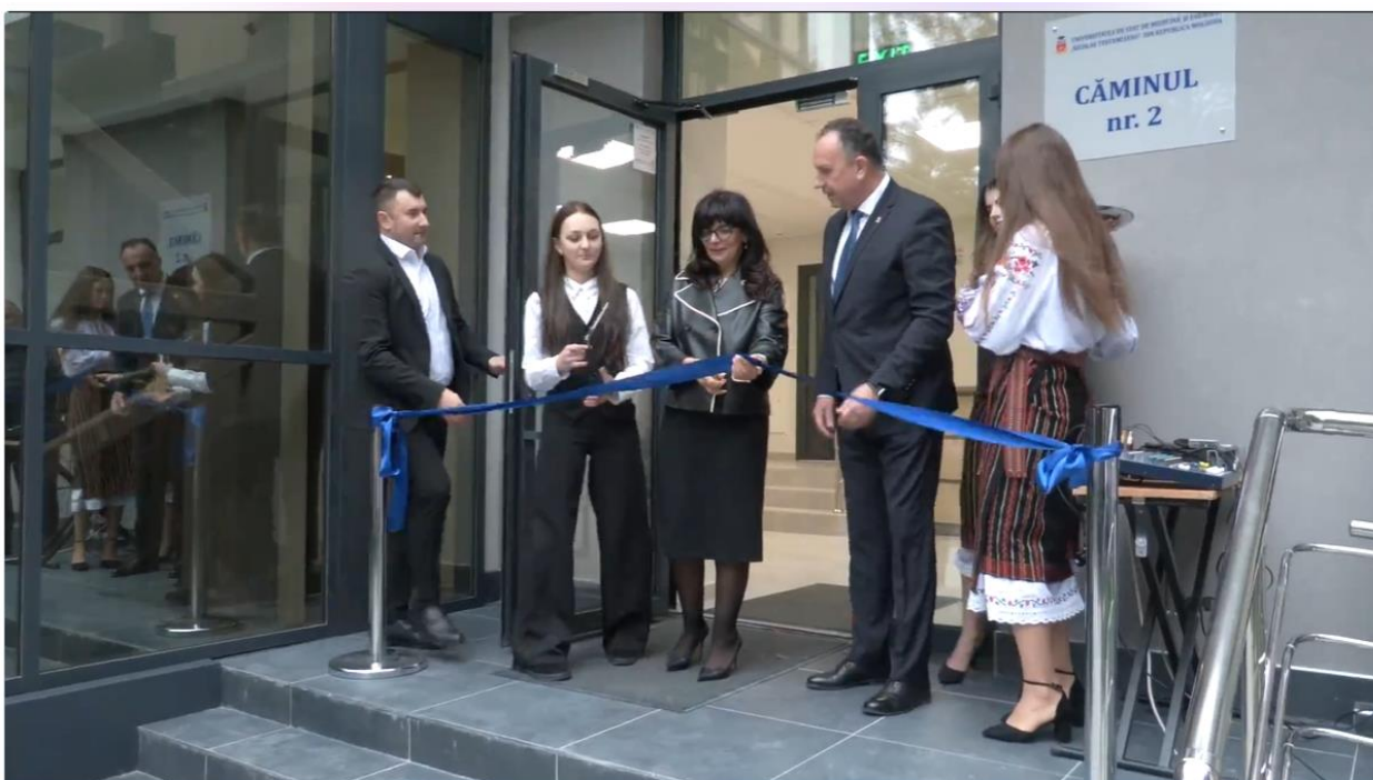
Deschiderea Căminului nr. 2 din Campusul studentesc al USMF „Nicolae Testemițanu”, după reconstrucția capitală

Link: https://www.privesc.eu/arhiva/107027/Deschiderea-Caminului-nr--2-din-Campusul-studentesc-al-USMF--Nicolae-Testemitanu---dupa-reconstructia-capitala