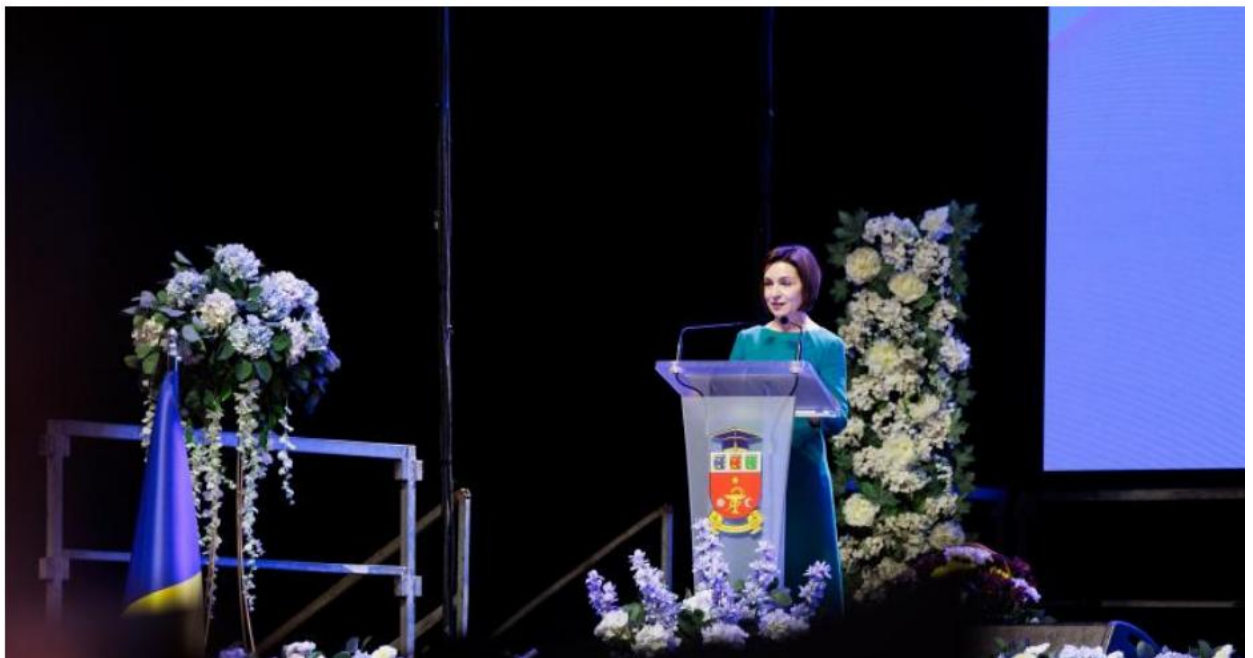
Președinta Maia Sandu a participat la ceremonia depunerii Jurământului medicului și farmacistului de către absolvenții USMF „Nicolae Testemițanu”

Șefa statului le-a mulțumit celor 1025 de absolvenți ai Universității de Stat de Medicină și Farmacie, în cadrul ceremoniei de depunere a Jurământului, pentru că au ales această carieră responsabilă și i-a felicitat pentru perseverență și disciplină de învățare.