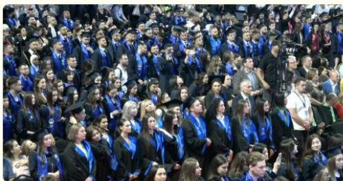
Ceremonia de depunere a Jurământului privesc.eu

Link: https://agora.md/2024/06/12/usmf-pest-1000-de-absolventi-din-14-tari-au-depus-juramantul-medicului-si-farmacistului