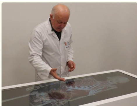
Masa interactivă Privesc.eu

Link: https://agora.md/2025/02/03/viitorii-medici-vor-invata-anatomia-inclusiv-in-format-digital-echipamentul-costa-23-milioane-de-lei-video