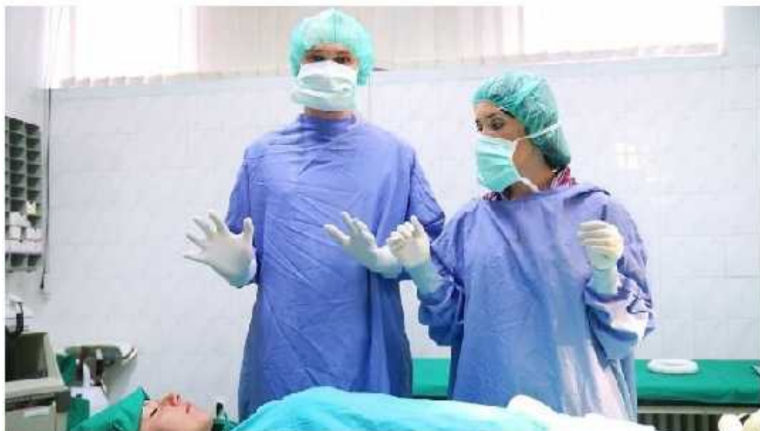
Circa 300 de doctori vor fi instruiți în cadrul proiectului transfrontalier.

Medicii din Republica Moldova, România și Ucraina vor căuta împreună metode mai eficiente de prevenire a bolilor cronice.