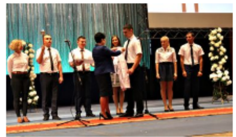
Viitorii medici au dat start primului an de studiu.

Evenimentul s-a desfășurat la Palatul Național "Nicolae Sulac" și a adunat reprezentanții Parlamentului, Ministerului Educației, Culturii și Cercetării, administrația universității, corpul academic, studenți, părinți și alți oaspeți.