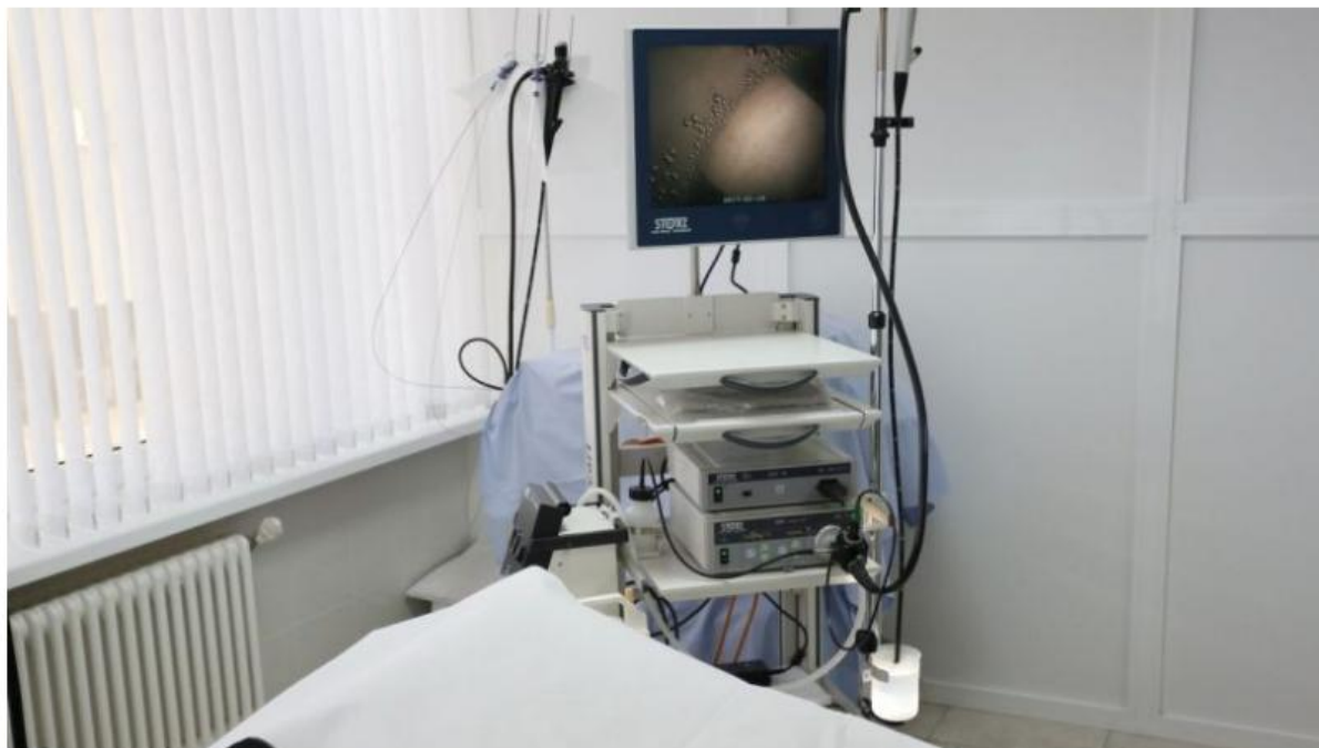
FOTO. A fost inaugurată Secției Endoscopie din cadrul Spitalului Clinic Republican

Link: http://birfe.xyz/foto-a-fost-inaugurata-sectiei-endoscopie-din-cadrul-spitalului-clinic-republican/