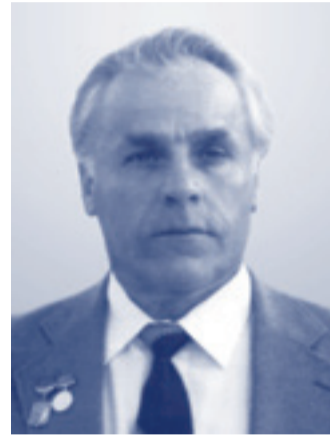
Timofei Moșneaga (1932-2014) – ministru al sănătății, iscusit manager și Medic al Poporului