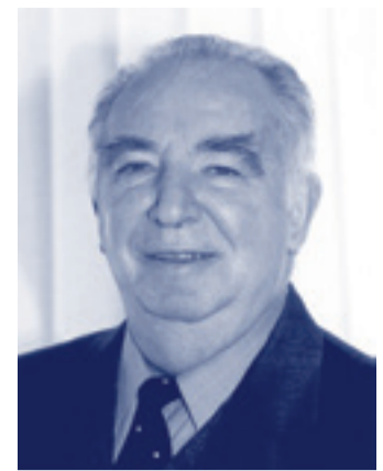
Eugen Gladun (1936-2014) – ministru al sănătății, membru corespondent al AȘM, Om cu o vastă cultură umanistă