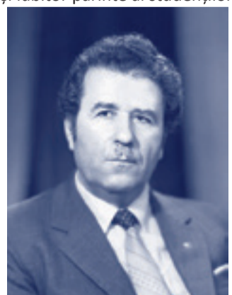
Nicolae Testemițanu (1927-1986) – rector și ministru al sănătății, academician, profesor și Om de stat